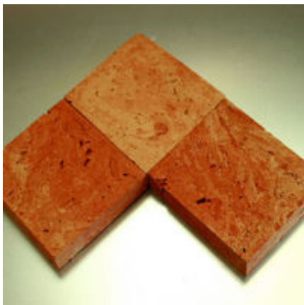
Wandbelag / Bodenbelag