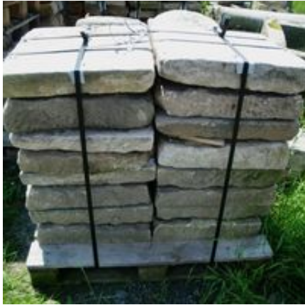
Stein, Sandstein, Granit